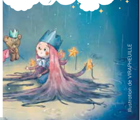
Illustration de VIRAPHEUILLE