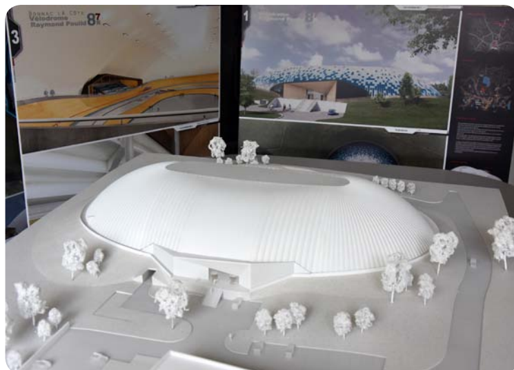
Photo de simulation avec couverture - architecte FSDC et associés

Le choix du maître d'oeuvre pour la construction d'une couverture a été arrêté le 11 avril dernier. Il s'agit de la société FSDC et Associés, dont la solution combinant dôme gonflable et entrées bâties en structure métal a été retenue par la Commission d'appel d'offres. Les travaux de couverture débuteraient au 4 ème trimestre 2016 et pourraient s'achever en juin 2017.