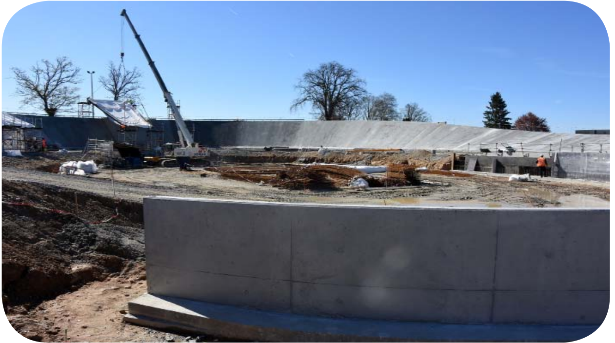
Photo de simulation avant couverture